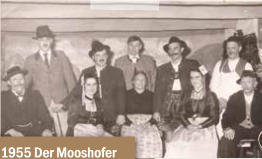
1955 Der Mooshofer und sein Sohn