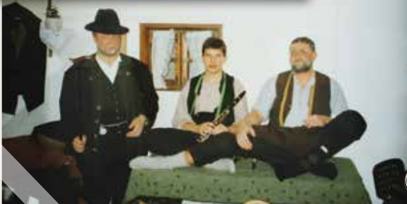
1994 Der Hunderter im Westentascherl