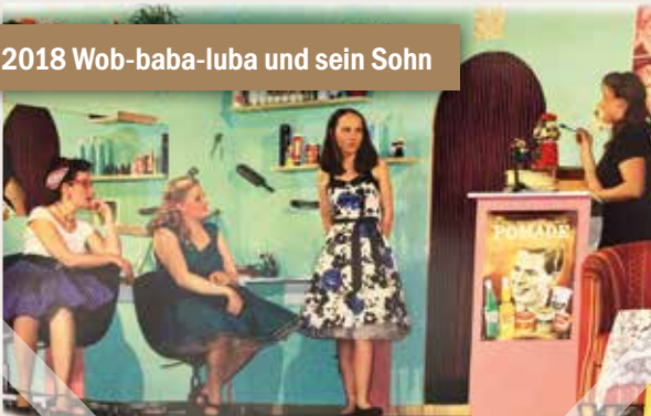
2018 Wob-baba-luba und sein Sohn