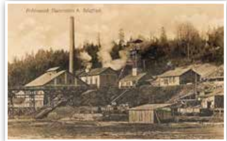
Postkarte von 1910

Marienstein, das war einst ein Bergwerk und ein Zementwerk, dazu Werkwohnungen. Zur Erhöhung der Produktivität des Kohleabbaus wurde 1904 ein Förderschacht unterhalb von Brand abgeteuft. Der Schacht erstreckte sich bis zu 220 Meter (später 564 m) in die Tiefe. Die Flöze hatten eine Stärke von 70 bis 120 cm. 1962 fuhren die Bergleute die letzte Schicht, im Zementwerk war 1998 Schluss.