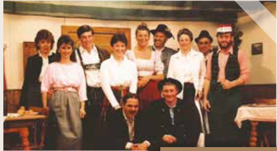
1986 Pfiffige Urschl