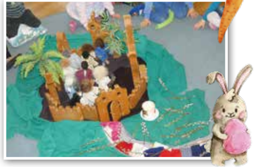
Palmsonntag – Einzug Jesu in Jerusalem

Glückaufstraße 7 · 83666 Waakirchen Telefon: 08021-1570 · Fax: 08021-507044 E-Mail: St-Martin.Waakirchen@kita.erzbistum-muenchen.de Internet: www.kiga-stmartin-waakirchen.de