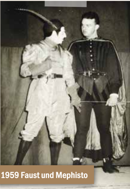
1959 Faust und Mephisto