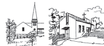
Erlöserkirche Gmund Heilig-Geist-Kirche Schaftlach

Evangelisch-Lutherische Kirchengemeinde 83703 Gmund a. Tegernsee Kirchenweg 15 E-Mail: pfarramt.gmund@elkb.de