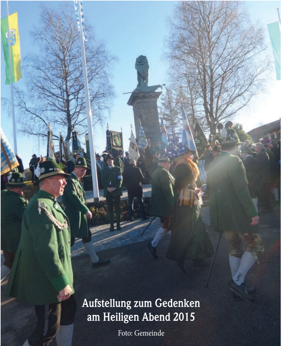
Aufstellung zum Gedenken am Heiligen Abend 2015