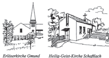
Erlöserkirche Gmund Heilig-Geist-Kirche Schaftlach

Evangelisch-Lutherische Kirchengemeinde 83703 Gmund a. Tegernsee Kirchenweg 15 E-Mail: pfarramt.gmund@elkb.de