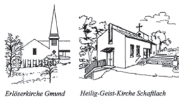
Erlöserkirche Gmund Heilig-Geist-Kirche Schaftlach

Evangelisch-Lutherische Kirchengemeinde 83703 Gmund a. Tegernsee Kirchenweg 15 E-Mail: pfarramt.gmund@elkb.de