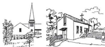
Erlöserkirche Gmund Heilig-Geist-Kirche Schaftlach

Evangelisch-Lutherische Kirchengemeinde 83703 Gmund a. Tegernsee Kirchenweg 15 E-Mail: pfarramt.gmund@elkb.de