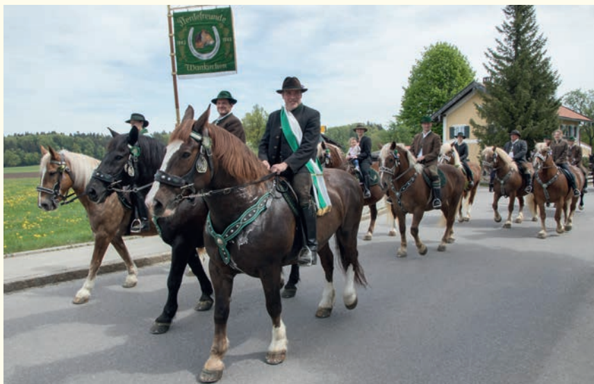
Kreuzritt 2018

Anschließend besteht die Möglichkeit zur Einkehr beim Frühschoppen im Pfarrsaal in Schaftlach